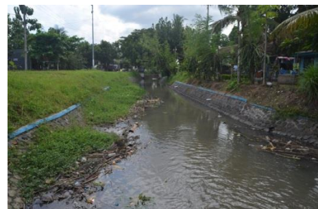
Gambar 9 Sedimentasi pada R. PA. 4 Sepanjang 1m x 15m x 0,5m (Saluran Sekunder Paleran)