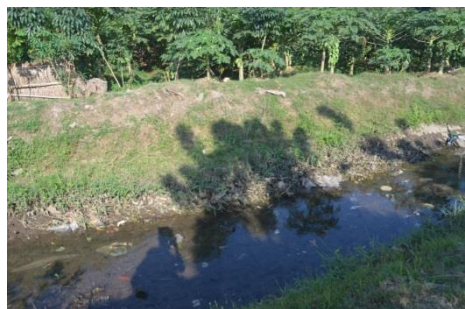
Gambar 6 Roboh pada Ruas 1 (R. BA. 1) Sepanjang 6m (Saluran Sekunder Balung)

Kerusakan-kerusakan yang terjadi pada aset irigasi tersebut dapat terjadi secara alami maupun akibat tindakan manusia. Contoh kerusakan yang disebabkan secara alamiah adalah kerusakan akibat adanya bencana alam. Selain itu, kerusakan juga dapat disebabkan oleh hewan berupa kepiting/biawak/hewan lain yang membuat sarang pada bangunan irigasi. selain itu, kerusakan pada aset ini dapat disebabkan oleh aktifitas manusia seperti dengan sengaja membuat lubang pada saluran agar air dapat mengalir bebas ke lahan sawah.