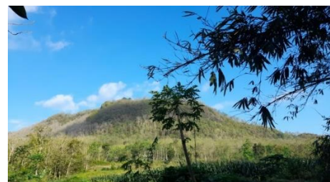
Gambar 10 Gunung Manggar di Desa Kesilir, Kecamatan Wuluhan