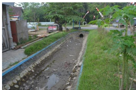
Gambar 4 Berlubang pada B. NO. 1 sepanjang 0,7m (Saluran Sekunder Nogosari)