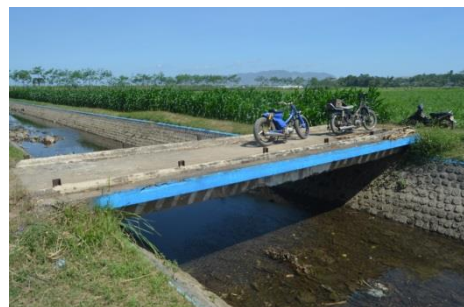
Gambar 8 Lengan Jembatan Rusak pada B. PU. 1a (Saluran Sekunder Puger)