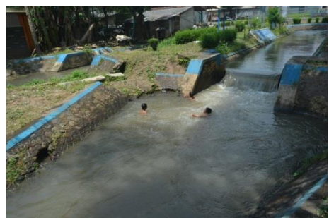
Gambar 5 Longsor pada B. UT. 4 Sepanjang 1,5m (Saluran Primer Utara)