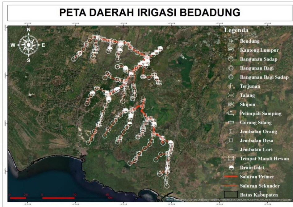
Gambar 1 Peta Wilayah Penelitian