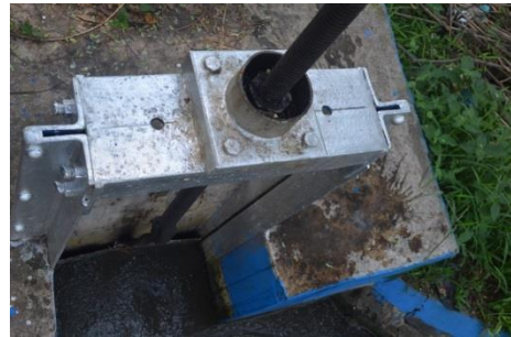
Gambar 7 Daun Pintu Bengkok pada B. UT. 3 (Saluran Primer Utara)

terjadi saat ini dapat berpengaruh jika kerusakan-kerusakan pada aset irigasi DI Bedadung tidak dilakukan perbaikan sehingga mempengaruhi dalam penyaluran air.