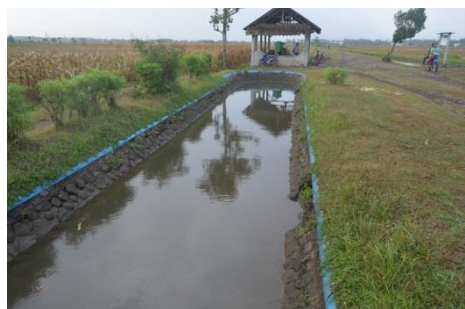
Gambar 3 Retak pada B. WA. 1 Sepanjang 2 m (Saluran Sekunder Watangan)