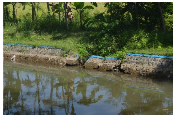
Gambar 12 Drain Inlet (B. BAR. 1b) pada Saluran Primer Barat